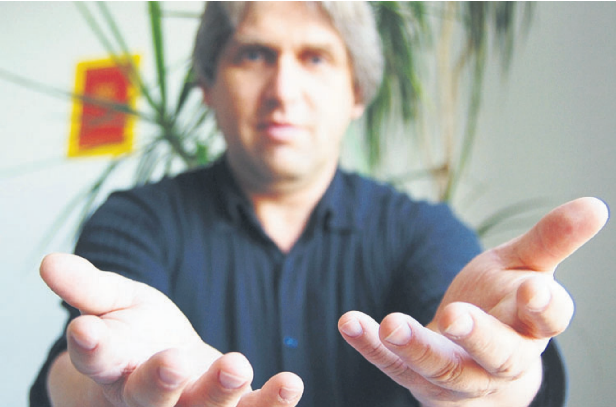
Die Frage nach dem Sinn des Lebens führt meist auch zu einer genauen Betrachtung des Selbst.